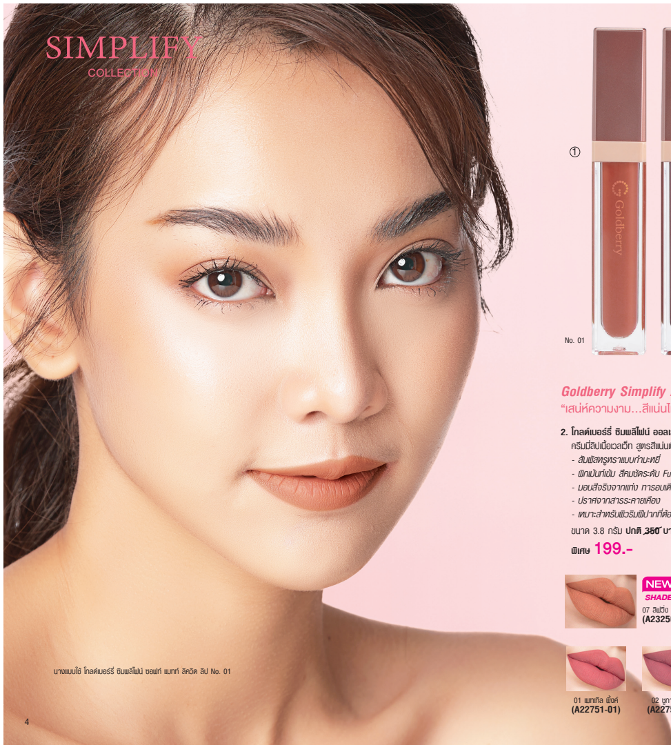
บางแบบใช้ โกลด์เบอร์รี่ ซิมพลิไฟด์ ซอฟท์ แมทท์ ลิกวิด ลิป No. 01